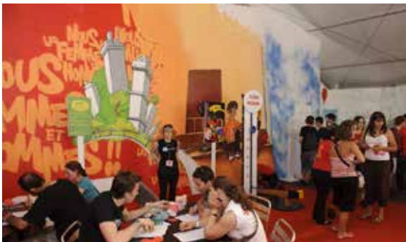
Stand pour le festival Solidays 2009